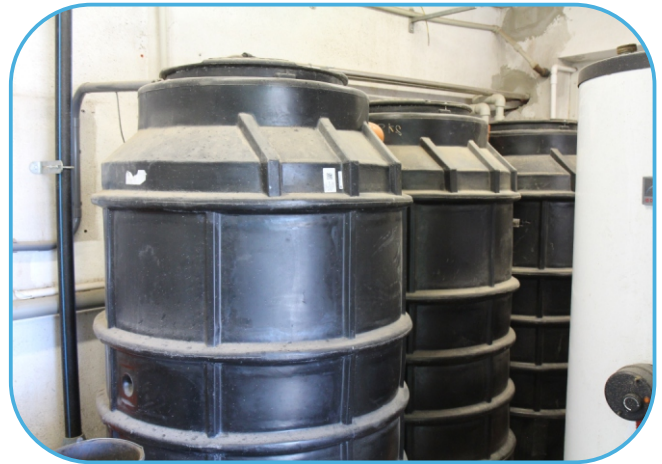
nádrže na odpadní vody z proplachu mléčného potrubí