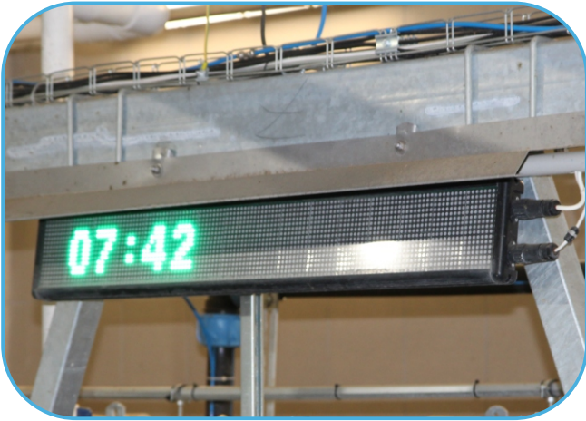
info panel je umístěný přímo na dojírně