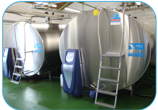
chladičí tanky SERAP na mléko