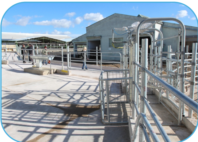
selekční branka na výstupní uličce