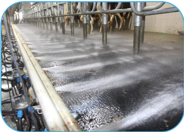
systém oplachu stání dojírny