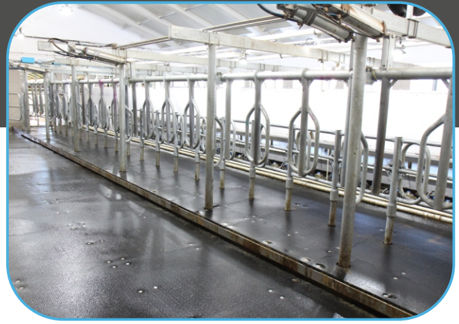
přítlaka a rychlý odchod z dojírny