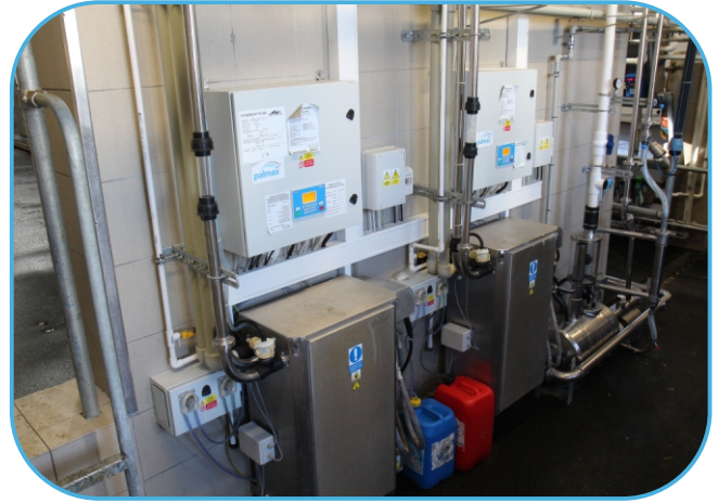
čerpadla mléka a desinfekční automaty