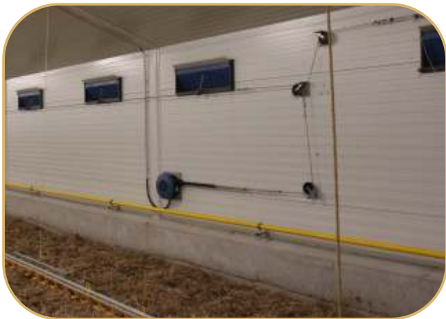
sténové přívodní klapky a systém ovládání