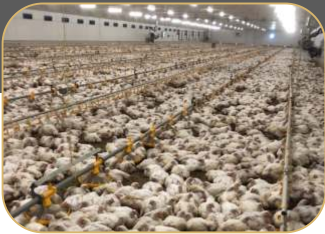
elektricky zvedané linky krmení a napájení