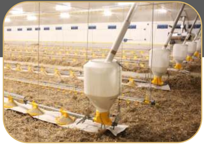
system krmení, misková krmítka KICK-OFF 330°