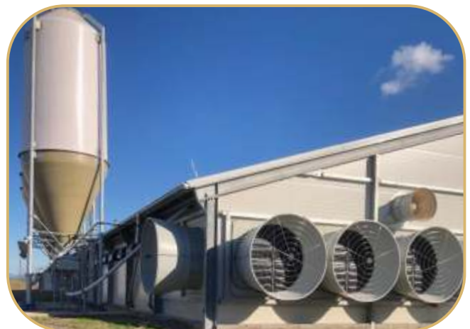
sklolaminátové zásobníky krmiva a štítové ventilátory