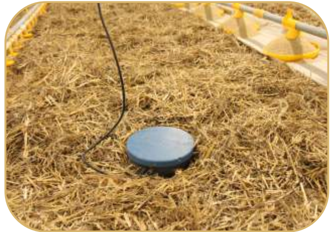
automatická váha na kuřata