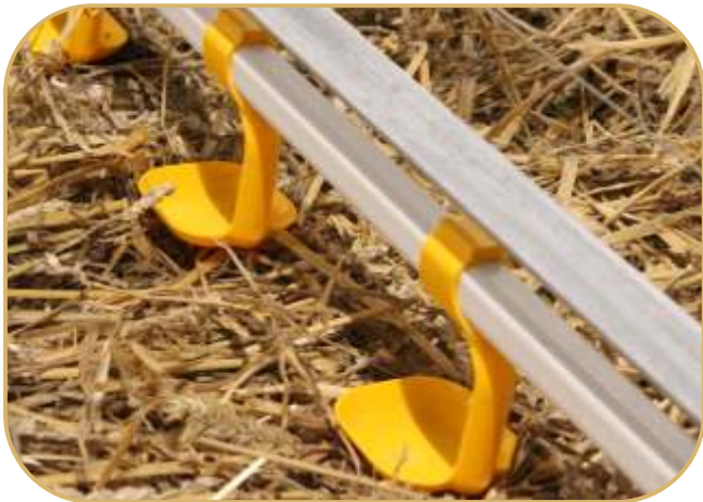
napáječky s nerezovými niplý