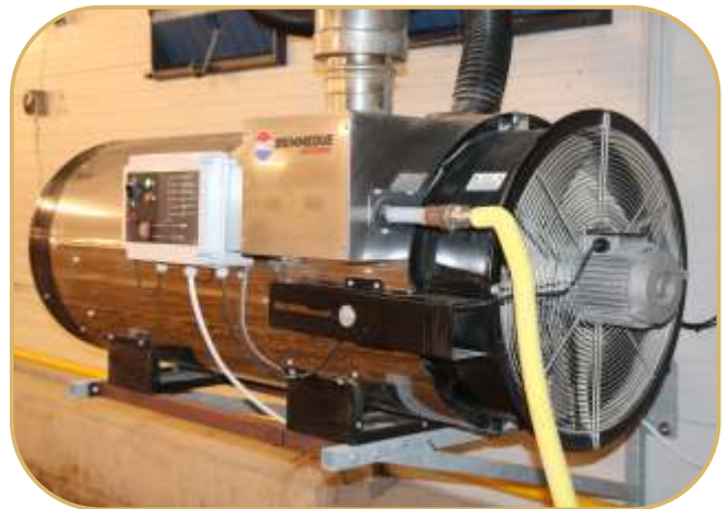
topidlo BH 100 s přívodem vzduchu a odvodem spalin