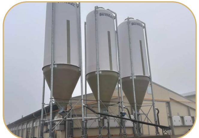
sklolaminátové sila vč. tenzometrů