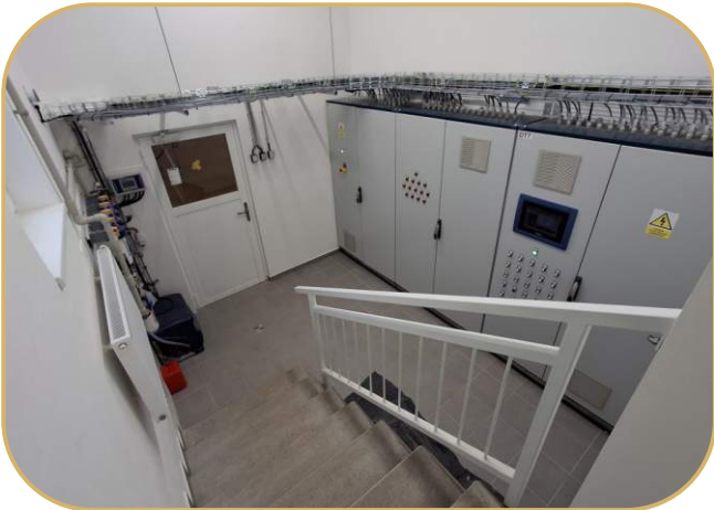
rozdávěče s integrovaným klima a produkčním počítačem