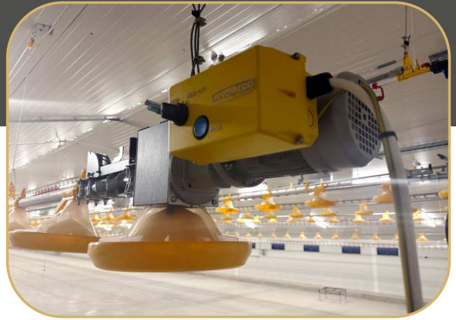
kontrolní krmítka s LED osvětlením