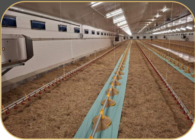
elektricky zvedané krmné a napájecí linky