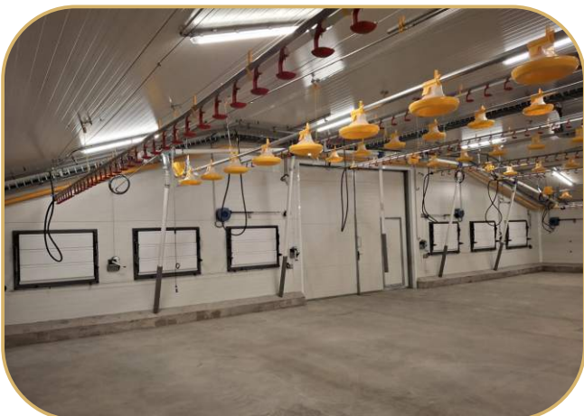
tunelové klapky v předním štítu haly