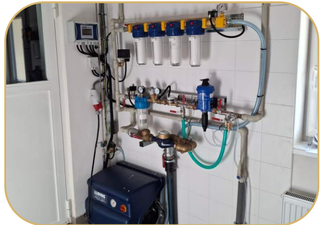
uzel s medikátorem pro systém napájení