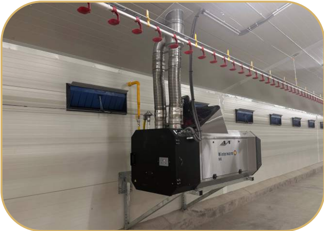
plynové topidlo DXC s nepřímým spalováním WinterWarm