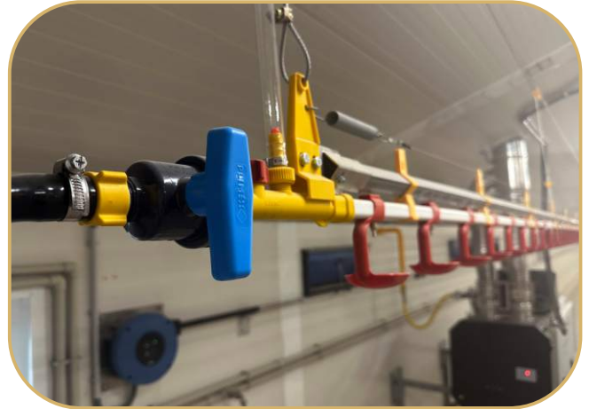
hladinový snímač s uzávěrem