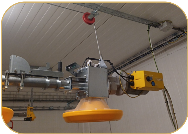
kontrolní krmítko s LED osvětlením