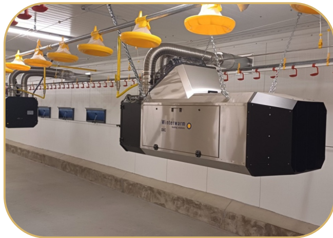
plynové topidlo DXC s nepřímým spalováním WinterWarm