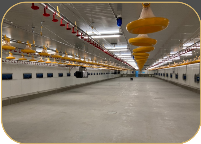
elektricky zvedané krmné a napájecí linky