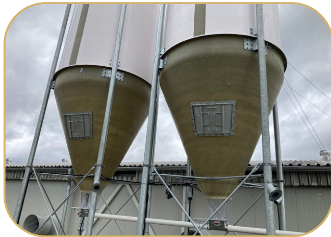
sklolaminátové sila vč. inspekčních vstupů s dvířky