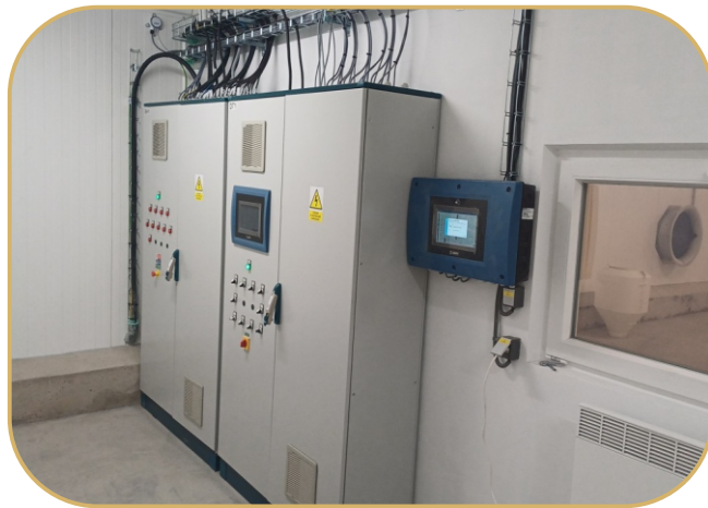
rozvaděče s integrovaným klima a produkčním počítačem