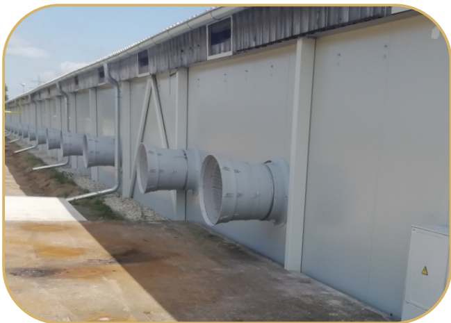
odtahové komíny umístěné do boku stáje