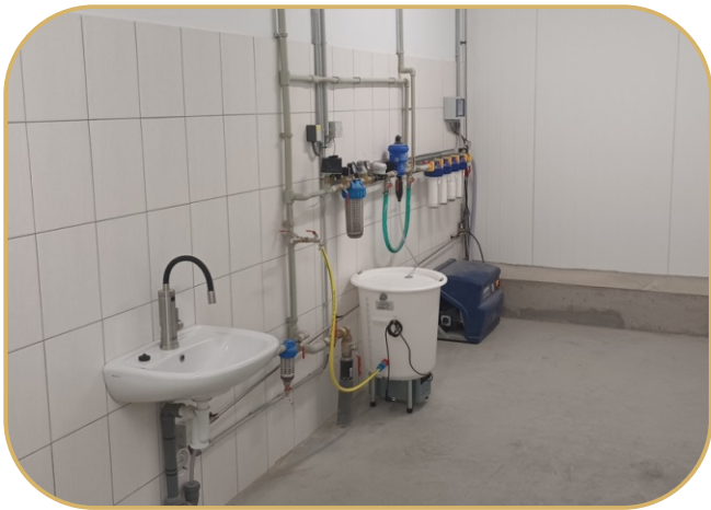
medikační uzel, čerpadlo vysokotlakého chlazení