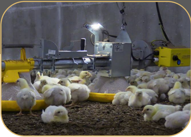
LED osvětlení kontrolního krmítka