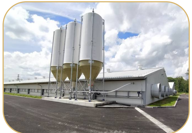
sklolaminátové zásobníky na tenzometrech