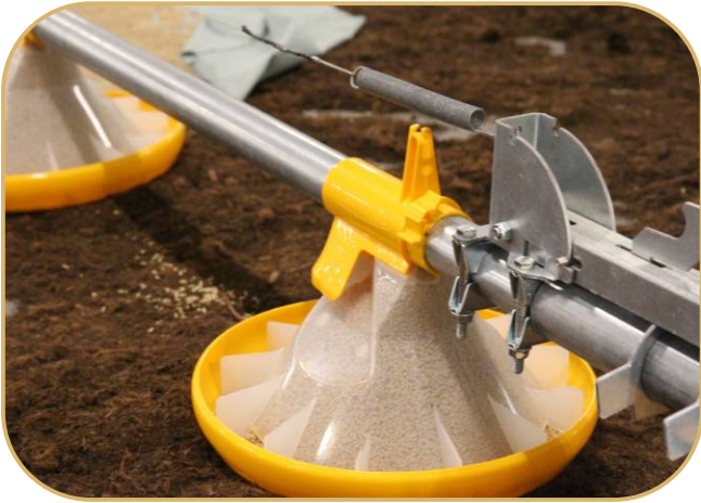
miskové krmítko KICK-OFF 330°