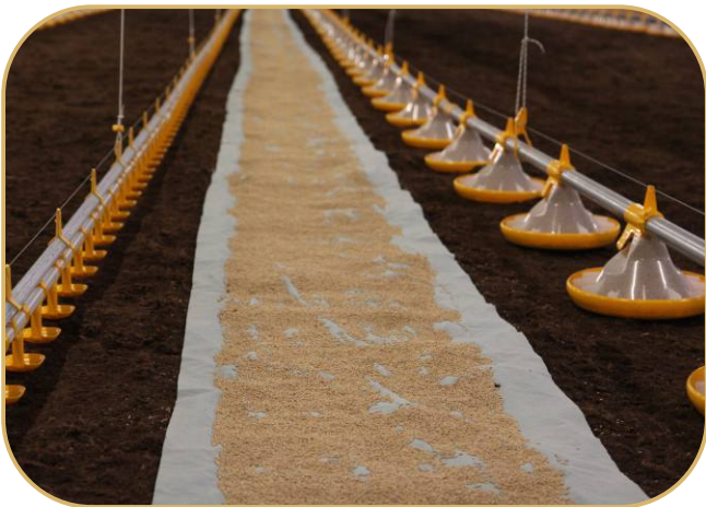
napájecí a krmné linky