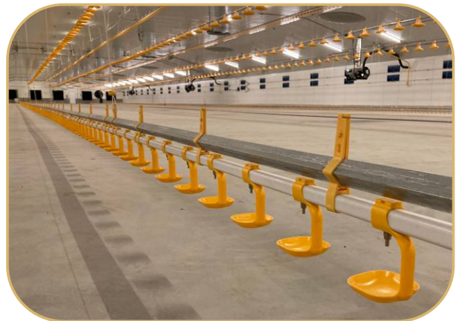
miskové napáječky s nerezovými niplý