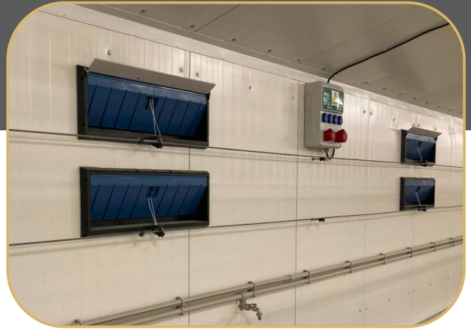
stěnové přívodní klapky