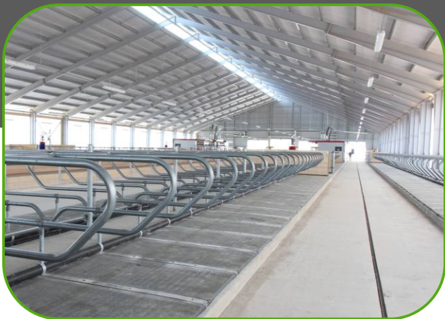
uspořádání stáje s dojícími roboty