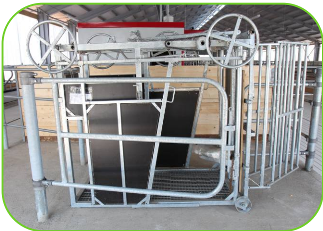
klec na ošetování paznehtů