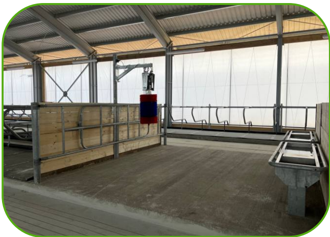
napájecí žlaby JUPITER, drbadlo a boční svinovací plachty