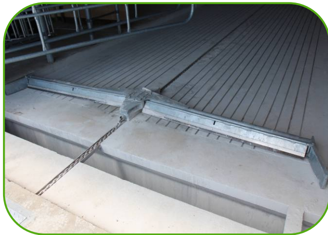
skládací shrnovací řetězová lopata - systém DELTA II