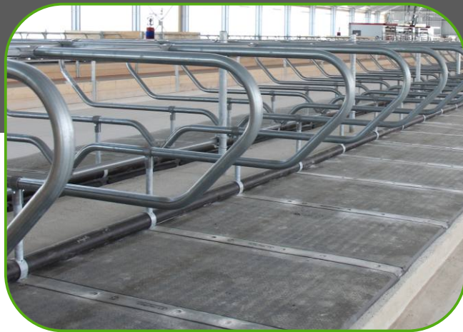
lehací boxy s měkkou matrací a prsní opěrkou