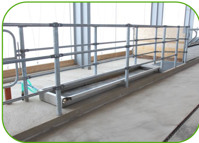
automatická lavážní vana