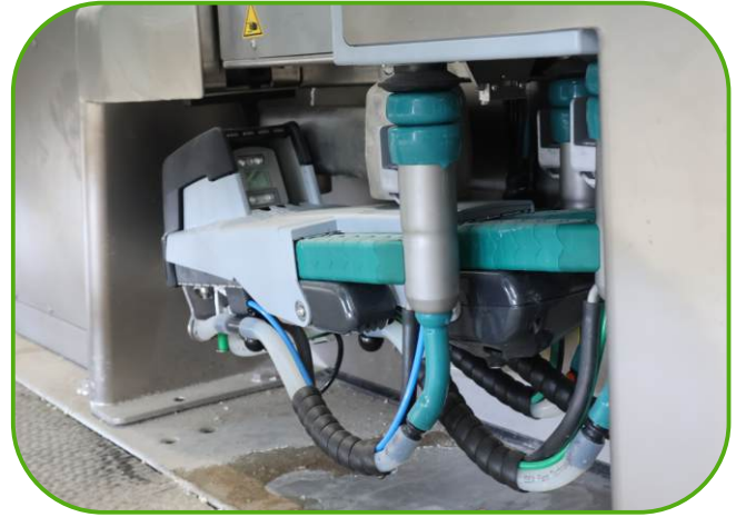
rameno dojícího robota