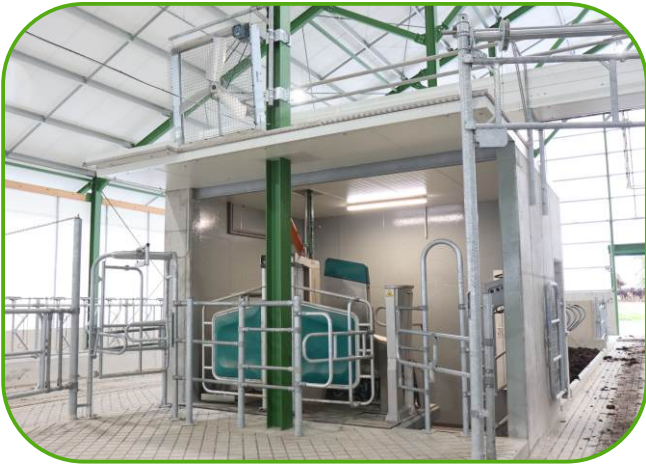
ve stáji jsou čtyři dojící roboti GEA