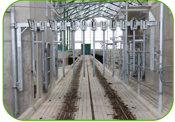
prstové branky pro řízený pohyb dojníc