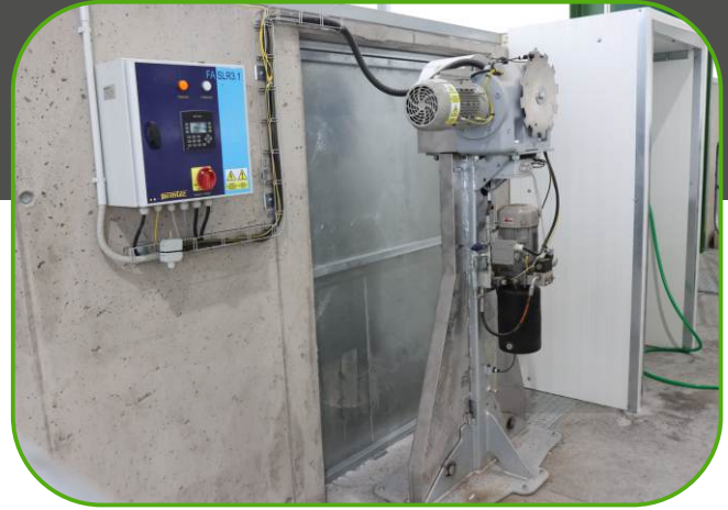
pohonná jednotka řetězový systém DELTA II