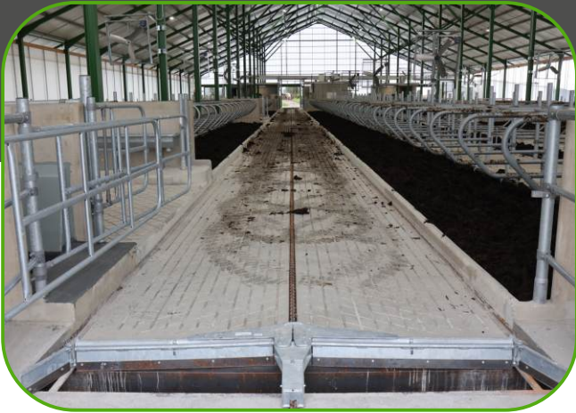
skládací shrnovací řetězová lopata na odklíz kejdy