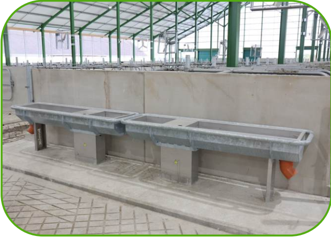
nerezové vyhřívané napájecí žlaby JUPITER