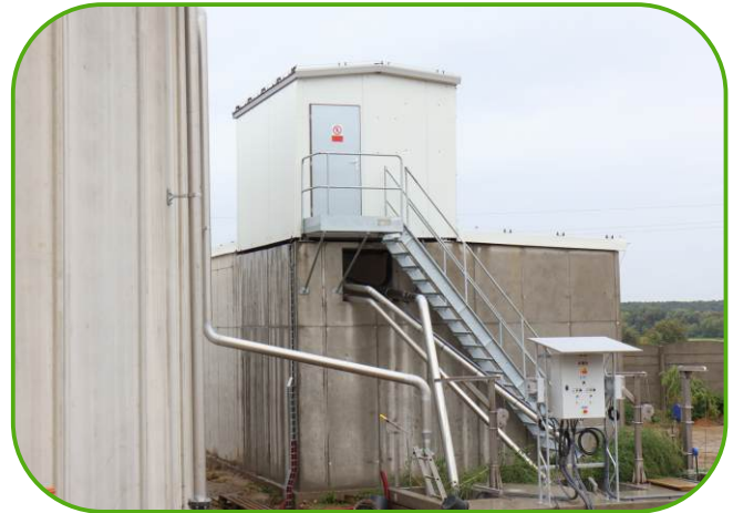
izolovaný přístřešek na separátor kejdy