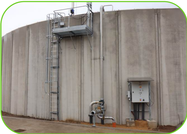
prefabrikovaná skladovací jímka na kejdu