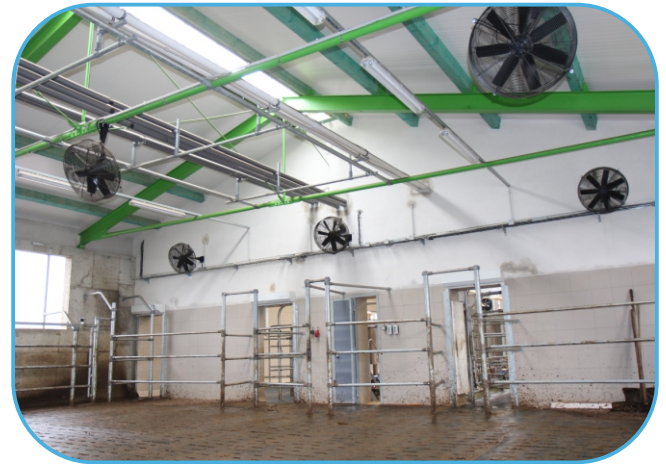
ventilátory v čekárně před dojením