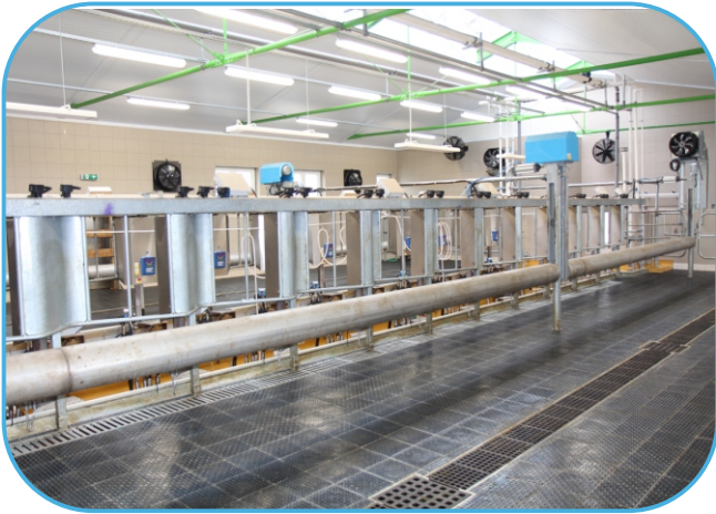
přítlak dojnic a rychlý odchod z dojírny