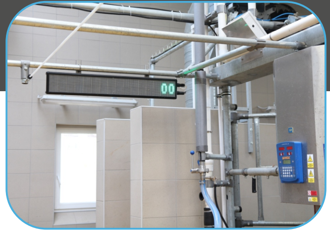
info panel v jámě dojiče ukazuje nastupující krávy