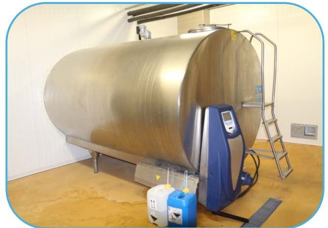
chladičí tank na mléko