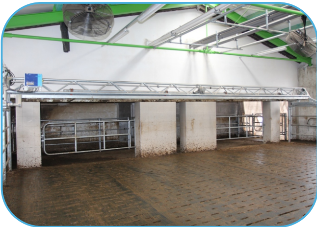
přihaněč dojnic v zarošтовané čekárně