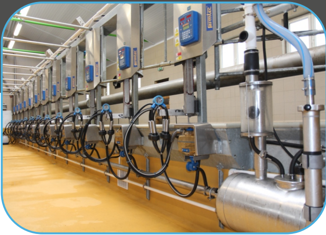
rybinová dojírna s polohovatelnými rameny dojičho stroje