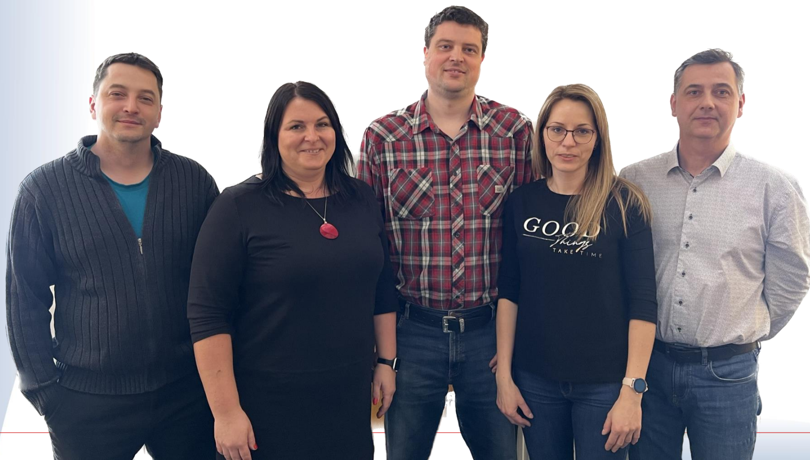
foto – středisko financování